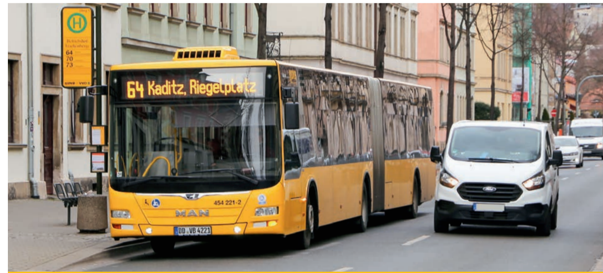
Solchen Situationen begegnen die Busfahrer der Verkehrsbetriebe immer häufiger. Autofahrer sollen dem Linienbus das Abfahren von der Haltestelle ermöglichen. In der Praxis müssen die Busfahrer oft lange auf eine Lücke warten.

Der vielzitierte Beginn der STVO gilt immer und überall. Für den Autofahrer, der auf den vielleicht vollbesetzten oder verspäteten Linienbus Rücksicht nehmen und dem Busfahrer das Abfahren ermöglichen sollte. Er gilt aber gleichermaßen auch für den Busfahrer, der sich das Einordnen nicht einfach erzwingen kann und seinerseits auf den nachfolgenden Verkehr Rücksicht nehmen muss. Der Schlüssel liegt wie so oft im Verständnis füreinander. Möglicherweise zaubert die neue Kampagne einigen Autofahrern beim Lesen ein Lächeln ins Gesicht. Um die lustigen Sprüche mal genauer unter die Lupe nehmen zu können, wird demnächst vielleicht wieder der Bus vorgelassen. Die Busfahrer und Fahrgäste werden es ihnen danken.