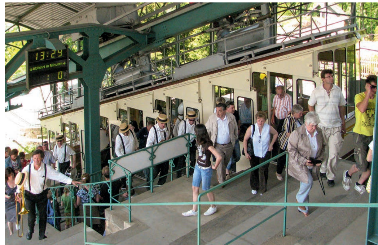
Auch 2020 gastieren die Dixie-Bands wieder im Schwebegarten an der Bergstation der Schwebbahn. Es könnte passieren, dass man die Musiker schon bei einer Session in der historischen Bahn antrifft.

Mehr Informationen zu Spielorten, Programm und Bands gibt es im Internet unter www.elbe-dixie.de . Aufgrund der begrenzten Parkmöglichkeiten wird die Anreise mit öffentlichen Verkehrsmitteln empfohlen.