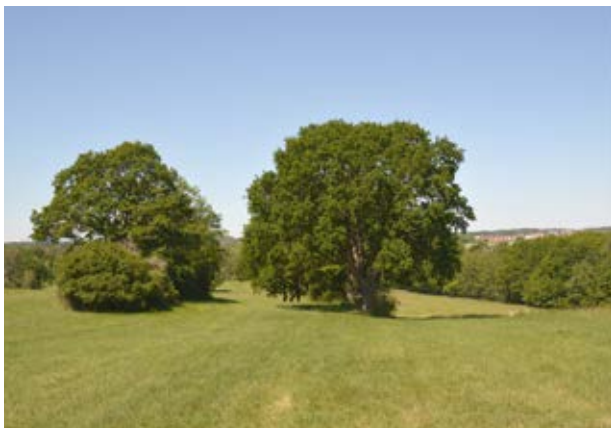
alte Eichen am Wegesrand (3)

Sie folgen dem Feldweg weiter nach Osten und zweigen nach rechts ab. Sie kommen auf eine Wiese mit einem dahinterstehenden Heckenrain zu und gehen nach links. Sie erreichen, kaum auffallend, den höchsten Punkt dieses Streifzuges, den