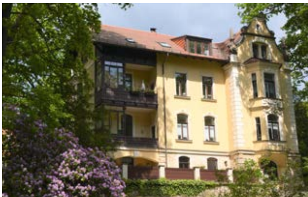
Villa in Klotzsche

gebildet. Im Kreuzungsbereich mehrerer Wege kommen Sie zu einem Rastplatz aus großen Stämmen. Rechts davon gehen Sie den Nesselgrundweg aufwärts, unterqueren die Eisenbahnbrücke und erreichen Klotzsche. Bereits 1845 stand hier schon eine Brückenkonstruktion als Holztragwerk auf Steinsockeln und 1853 eine dreibogige Gewölbebrücke als Viadukt. Von der Eisenbahnanbindung profitierte das einstige Dorf. Auf vorherig königlichem Besitz wurden in der zweiten Hälfte des 19. Jahrhunderts Villen und Kureinrichtungen errichtet und der neugeschaffene Ortsteil fortan als Königswald bezeichnet.