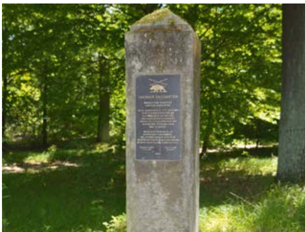
Gedenkstein für den Lausaer Saugarten (7)

beginnen den parallel zur Eisenbahntrasse verlaufenden Weg nach rechts. An der Kreuzung wählen Sie den grün markierten Weg, der halb rechts vor Ihnen liegt. Einige Meter vor der erkennbaren hochgelegenen Eisenbahnstrecke von Königsbrück nach Klotzsche kommen Sie auf ein Wegedreieck zu, in dessen Mitte unter Bäumen ein Gedenkstein für den Lausaer Saugarten (7) steht. Der Saugarten ist einer von vier historischen Wildgehegen in der Dresdner Heide. Diese dienten der Haltung eingefangener Wildschweine, die im Rahmen der höfischen Jagden wieder freigelassen wurden.