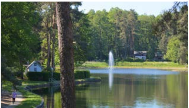
Badestelle Weixdorf am Großteich (1)

Sie beginnen den Streifzug an der Endhaltestelle der Straßenbahnlinie 7 in Weixdorf. Die Ortschaft Weixdorf ist im Laufe der vergangenen einhundertfünfzig Jahre durch Zusammenschluss der fünf Dörfer Lausa, Friedersdorf, Weixdorf, Gomlitz und Marsdorf entstanden. Obwohl schon im 14. Jahrhundert urkundlich erwähnt, blieben die Dörfer lange unbedeutend. Erst nach dem Bau der Eisenbahnstrecke von Klotzsche nach Königsbrück im Jahr 1884 siedelten sich kleinere Gewerbebetriebe an. Die Bauerndörfer wurden zu Arbeiterwohngemeinden für die Klotzscher und Dresdner Betriebe.