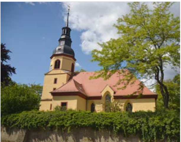
Lausaer Kirche (2)