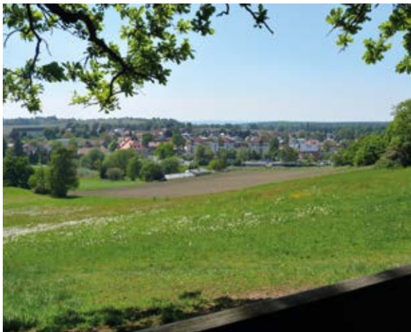
Blick vom Weißiger Hutberg (2)