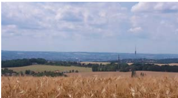
Aussicht vom Triebenberg (8)

anderem der „Bienert-Mühle“ in Dresden-Plauen. Rechter Hand über den Feldern sehen Sie bereits die bewaldete Kuppe des Triebenbergs. Der Grün-Punkt-Weg durch die Felder weist Ihnen den Weg vom einstigen Bahndamm bei Eschdorf zum Triebenberg (8) .