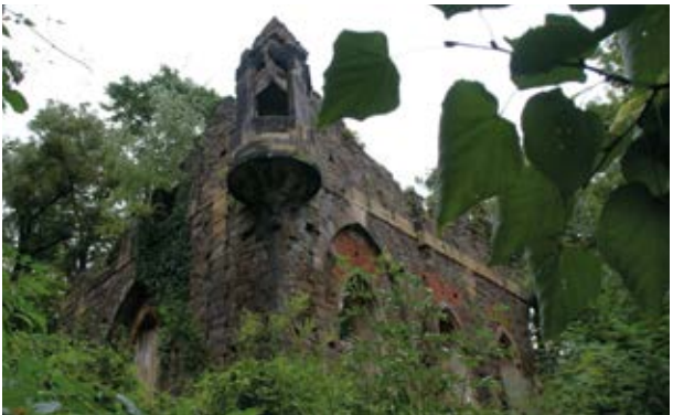
künstliche Ruine (13)