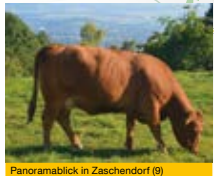
Panoramablick in Zschendorf (9)