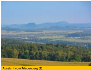
Aussicht vom Triebenberg (8)