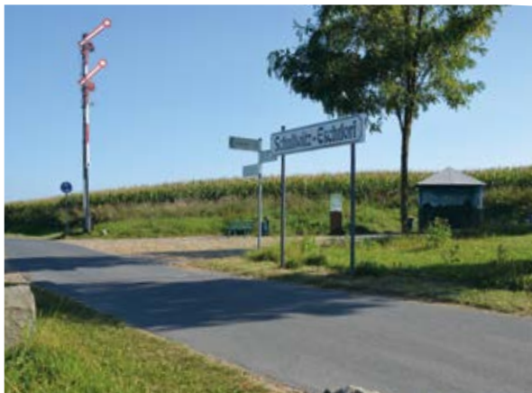
Haltepunkt Schullwitz – Eschdorf (6)

An einer Wendeschleife setzen Sie Ihre Wanderung auf einem kombinierten Fuß- und Radweg fort. Zwischen 1908 und 1951 war dies die Trasse einer Normalspurstrecke für Personen- und Güterbahnbetrieb zwischen Weißig und Dürrröhrsdorf über 14,7 Kilometer. Im Zuge des Ausbaus und der Umgestaltung des früheren Bahndammes zum ersten Themen-Fuß- und Radweg der Landeshauptstadt Dresden wurde hier ein sehr schöner Rastplatz am einstigen Haltepunkt Schullwitz – Eschdorf (6) eingerichtet.