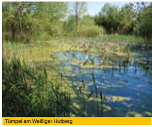
Tümpel am Weißiger Hutberg