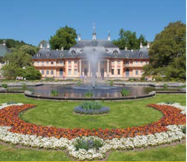
Schloss Pillnitz (16)

Nach knapp vierzehn Kilometern haben Sie das Ziel unseres Streifzuges erreicht. Mit den Buslinien 63 und 83 können Sie von der Haltestelle Rathaus Pillnitz den Heimweg antreten. Falls Sie noch mehr erkunden möchten, empfehlen wir Ihnen einen Spaziergang durch den Schlosspark Pillnitz oder einen Besuch des Museums im Palais (16) .